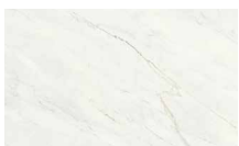
Glem White Nature

Xlight / Krion® finish Acabado Xlight / Krion®