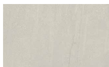
Aged Clay Nature