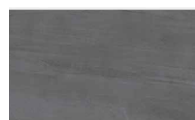
Aged Dark Nature